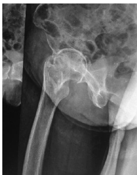
Εικόνα 3 Διουχενικό κάταγμα μηριαίου - Ημιολική Αρθροπλαστική Ισχύου με την τεχνική ALMIS