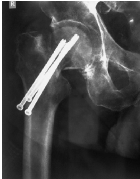
Εικόνα 1 Οστεονέκρωση μηριαίας κεφαλής σε έδαφος ηλωθέντος υποκεφαλικού κατάγματος. Αφαίρεση υλικών και μετατροπή σε ολική αρθροπλαστική με την τεχνική ALMIS

Με την A.L.M.I.S. Αρθροπλαστική ισχύου αποφεύγεται ο τραυματισμός των αγγείων της περιοχής, των νεύρων καθώς και των σημαντικών μυϊκών στοιχείων της άρθρωσης του ισχύου ώστε να μπορεί ο ασθενής να βαδίσει με πλήρη φόρτιση του σκέλους από την ίδια ή την επόμενη ημέρα του χειρουργείου. Η τομή δεν επεκτείνεται στον έξω πλατύ μυ και τα αγγεία του. Επιπλέον δεν τραυματίζονται κλάδοι της εν τω βάθει μηριαίας αρτηρίας (κλάδοι της πρόσθιας - έξω περιστεφωμένης αρτηρίας) ούτε τα άνω γλουτιαία αγγεία και νεύρα που συχνά υφίστανται κάκωση στις πλάγιες τύπου Hardinge προσπελάσεις. Στις περισσότερες περιπτώσεις δεν τέμνεται κανένας μύς του ισχύου, αλλά και στις πιο απαιτητικές περιπτώσεις αποκολλάται και επανακαθλώνεται μόνο το πρόσθιο 1/3 ή 1/4 τμήμα του μέσου γλουτιαίου μύος το οποίο ωστόσο δεν επηρεάζει την απαγωγή του ισχύου στην οποία συμμετέχει η οπίσθια ι-