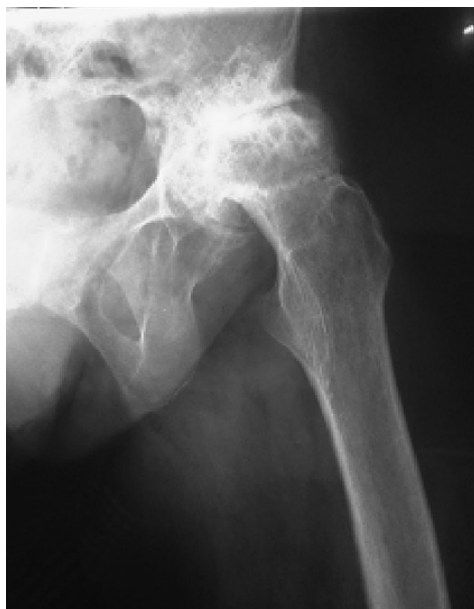
Εικόνα 2 Δυσπλαστικό Ισχίο - Ολική Αρθροπλαστική με την τεχνική ALMIS